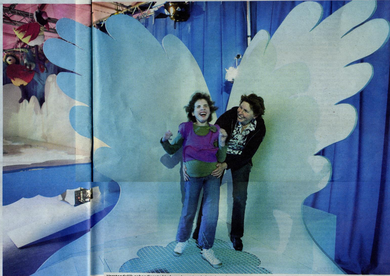
Verstandelijk gehandicapte kinderen in pretpark de Belevenis.

S lagroomsoesjes?! Zo - dat is lef hebben. Als er nou iets is wat je beter niet voor kunt zetten aan een tafel vol verstandelijk gehandicapten en dementie ouderen, zijn het slagroomsoesjes. Ze pletten zo lekker, die dingen. En dan spuit de room er zo heerlijk uit. Voor je het weet, sta je alleen nog maar neuzen, oren en meubilair te poetsen. Al zijn zelfs de luxe fauteuils hier van zacht maar eenvoudig schoon te maken kunststof gemaakt.